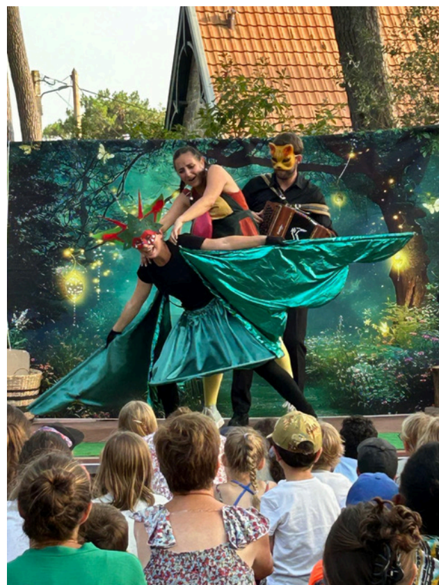
Représentation au festival le bruit des Dunes 2025

Cet univers coloré fait entrer le merveilleux au cœur du spectacle et permet à la légende de s'y déployer pleinement.